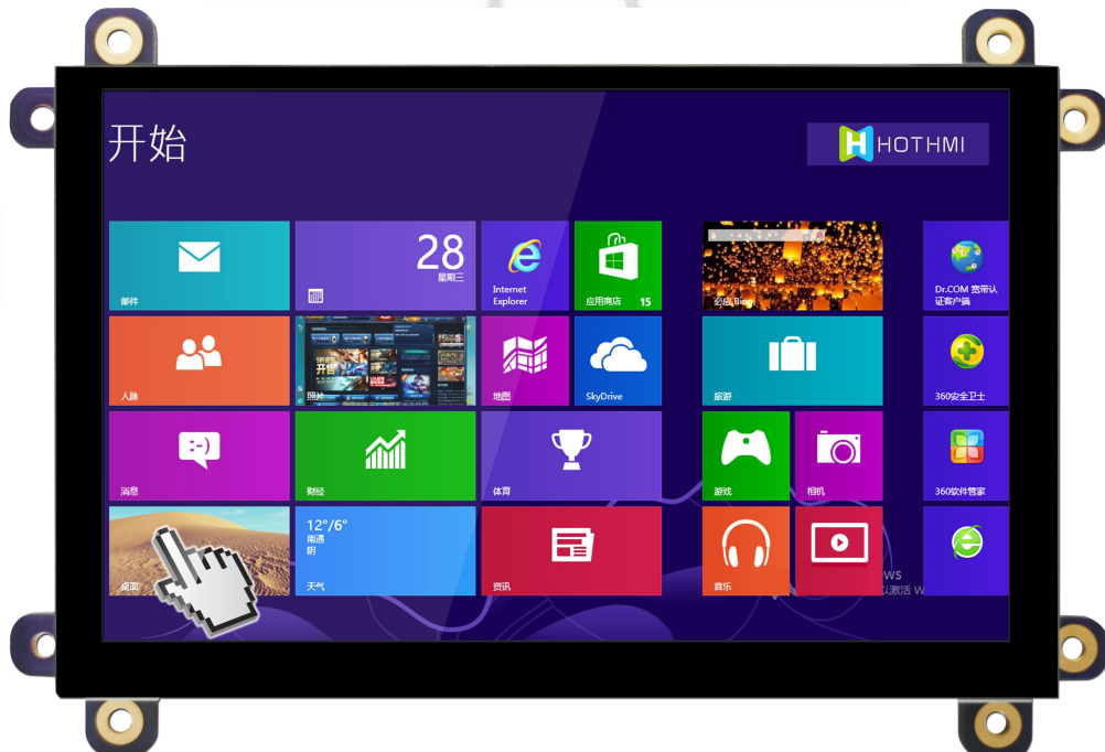
LCM-TFT050T61SVHVDVUSDC (带 USB 电容触摸)