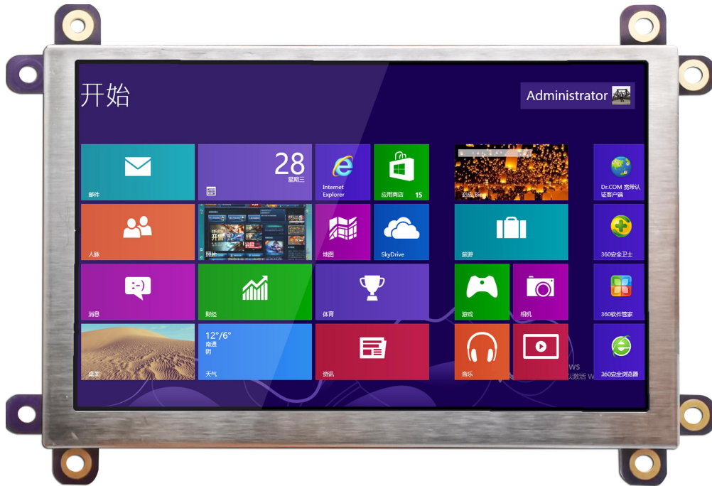
LCM-TFT050T61SVHVDVNSDC (不带 USB 触摸)